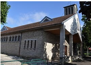
EGLISE ST JEAN BOSCO Rue de la Charmette