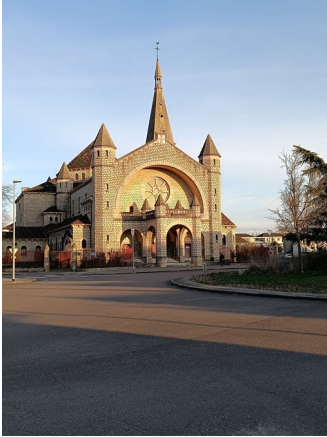
EGLISE SACRE COEUR 5 Bis rue Racine