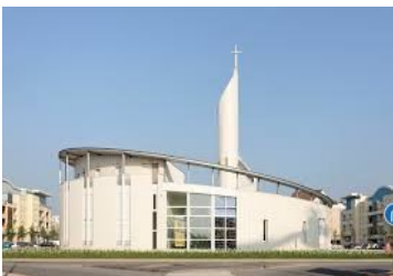
CENTRE ALBERT DE COURTRAY Place Granville