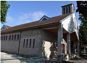
EGLISE ST JEAN BOSCO Rue de la Charmette